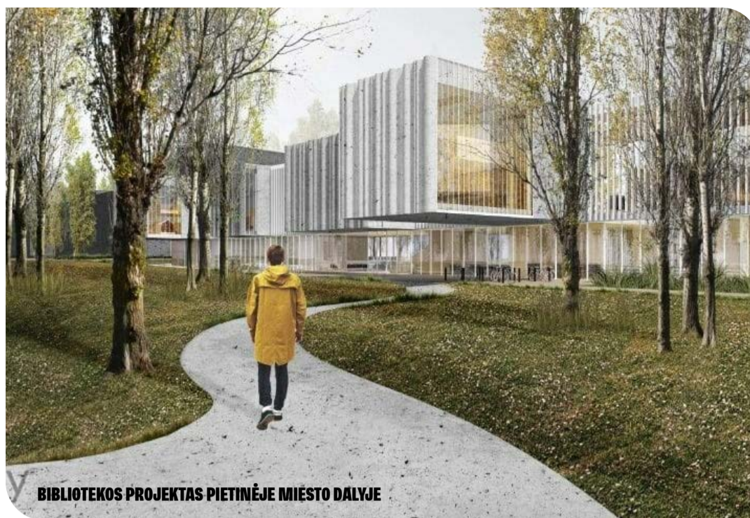
BIBLIOTEKOS PROJEKTAS PIETINĖJE MIESTO DALYJE

Klaipėdos miesto tarybos narys Edmundas Kvederis