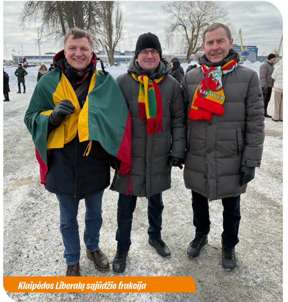
Klaipėdos Liberalų sąjūdžio frakcija