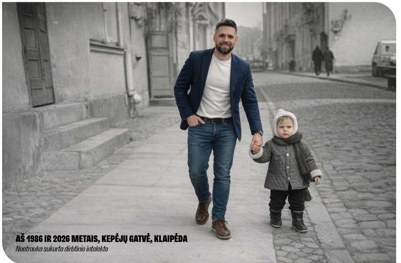
AŠ 1986 IR 2026 METAIS, KEPĖJŲ GATVĖ, KLAIPĖDA Nuotrauka sukurta dirbtinio intelekto